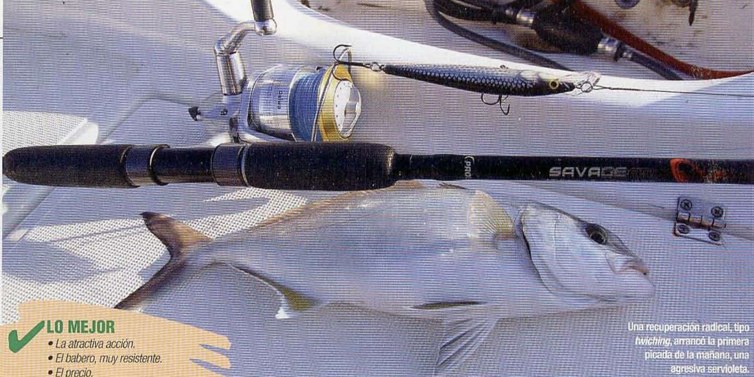
Una recuperación radical, tipo twitching , arrancó la primera picada de la mañana, una agresiva serviola.