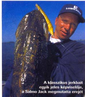
A klasszikus jerkbait egyik jeles képviselője, a Salmo Jack megmutatta erejét

Klasszikus jerkbait. A második részben már említettem a csoport egyik szlopos tagját, a jack -et. Ezzel a legnehezebb az eredményes horgászat, de ha belevetünk, a sikerek nem maradnak el. A nehézséget az jelenti leginkább, hogy szinte semmi ellenállást nem érzünk a vezetése közben, így könnyen elveszítjük a kontak-