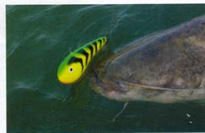
A vertikális horgászat egy lehetősége a sokból

jűk, és ismét hagyjuk lesüllyedni a meg- horgászni kívánt vízszalomba. Nehézsége mégis van a dolognak, hiszen pontosan kell ismerünk a halak tartózkodási he- lyét. A vertikális csalik között kiemelném a Salmo Chubby Dartert, mivel ez nem- csak függőlegesen működik, hanem hú- zásra kitér oldalra. Természetesen itt sem feledkezzhetünk meg a csalivezetés variá- cióiról.