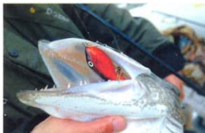
A mohó csuka nem tudott ellenállni a Stickbaits (Maas Marauder) mozgásának