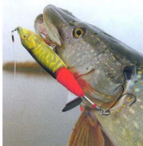
Csodálatos látvány, amikor egy ilyen csuka leszedi a wobblert a vízfelszínről

műen a látványos kapásokra vezethető vissza, hiszen felér egy adrenalinbombával, amikor a felszínen mozgó csalit lenyúlja egy ragadozó. A felszíni csaliknak is különböző típusai vannak, melyek sok dologban megegyeznek. Először is, mivel felszíni csaliról van szó, minden darabja úszó, tehát a bedobás után a vízfelszínen lebeg, és nagy része kilóg a vízből. Másodsor: jelentős zajt keltenek a vízfelszínen vezetve, s ez a zaj (annak ellenére, hogy sok horgász azt gondolja, ezért fogós a csali) nem mindig hozza meg a várt eredményt. Meg kell tanulni „halkan” is vezetni a felszíni csalikot, és mindkettőt alkalmazni.