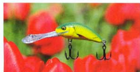
A sötét vizek egyik sikerszíne, a sárga tancos, azaz a Yellow Dance

reken, melyek feltöltődnek fényvel, amit sötét környezetben adnak ki magukból. Az alábbi táblázatban megpróbáltam összeszedni a leglényegesebb salmós színeket. Az első oszlop a gyártó által megadott színek kódjait tartalmazza, a második az angol megfelelőjét, ami alapján létrehozhatók a színkódok. A harmadik oszlop-