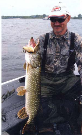
A bodorkaminta tetszett a csukának, valószínűleg ez lehet e vizen a fő tápláléka

igénye nélkül – a Salmo színskáláját vettem alapul. Itt megtalálhatók az extrém színek is, például a lumineszkáló wobble-