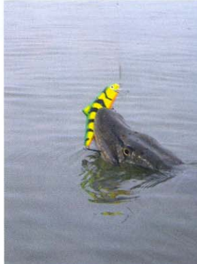
Mintha a kutyánknak dobtuk volna el kedvenc aprtaját, úgy viszi a száájában a csuka a Skinnert