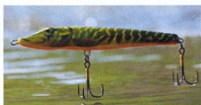
Egy csukaimitáció (Jack HPE)

Végezetül, hogy ne csak a színek unalmasnak tűnő variációjáról legyen szó, követezzék néhány jó tanács! Tegyük fel, hogy kiválasztunk egy wobblertípust, és