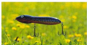
A tiszta vizeken lehet eredményes a valóban sötét csali (SNO)

A táblázat sokat segíthet, ha hallunk egy