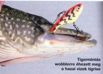
Tigrismintás wobblerre éhezett meg a hazai vizek tigrise

Talán az egyik legnépszerűbb szín a GT, vagyis a zöld tigris a harcsáknak is tetszik