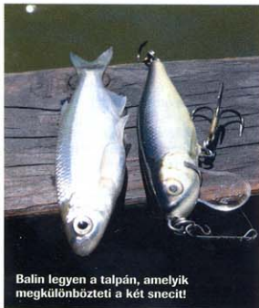
Balin legyen a talpán, amelyik megkülönbözteti a két snecít!

igénye nélkül – a Salmo színskáláját vettem alapul. Itt megtalálhatók az extrém színek is, például a lumineszkáló wobble-